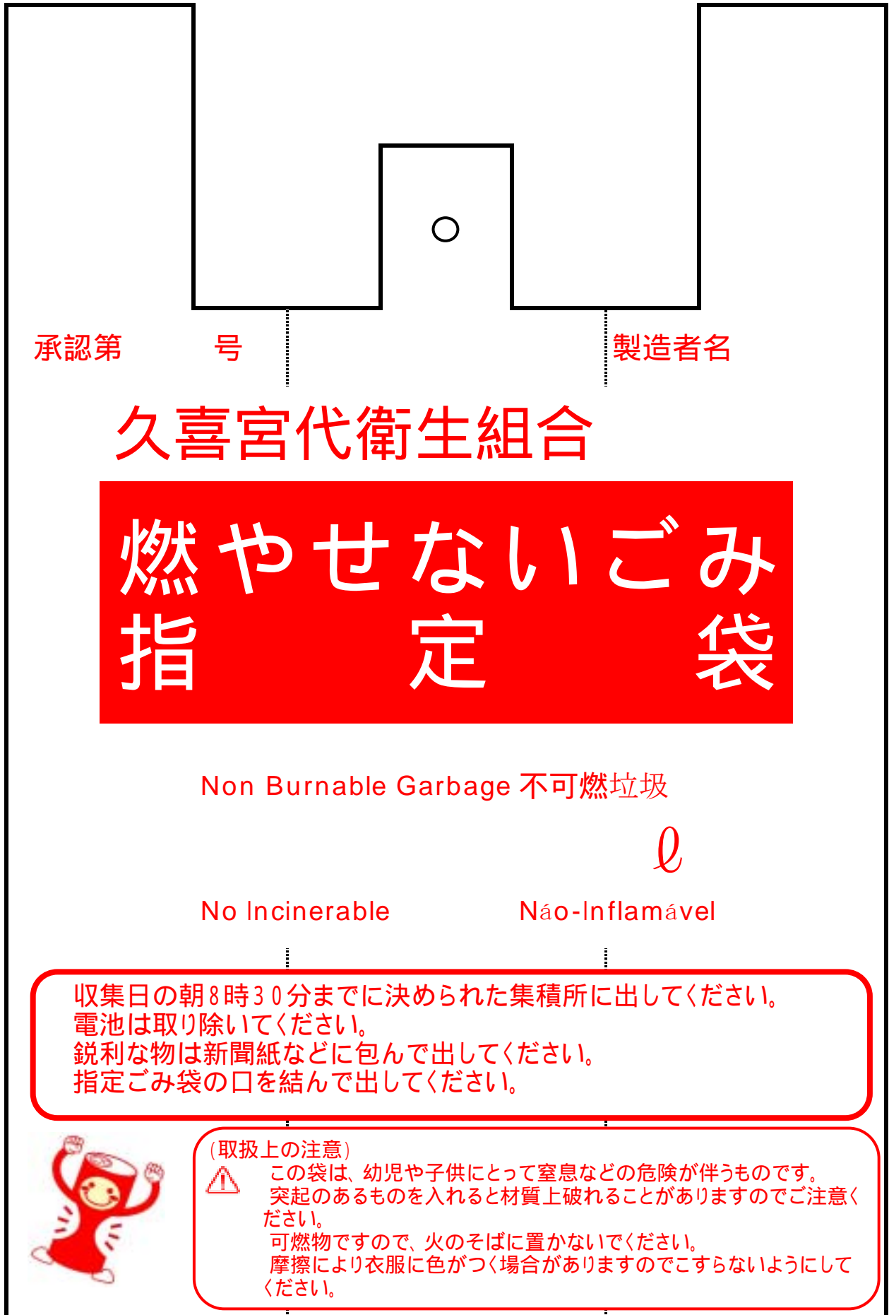
別図2 (第4条第2項) 燃やせないごみ用指定袋の表示