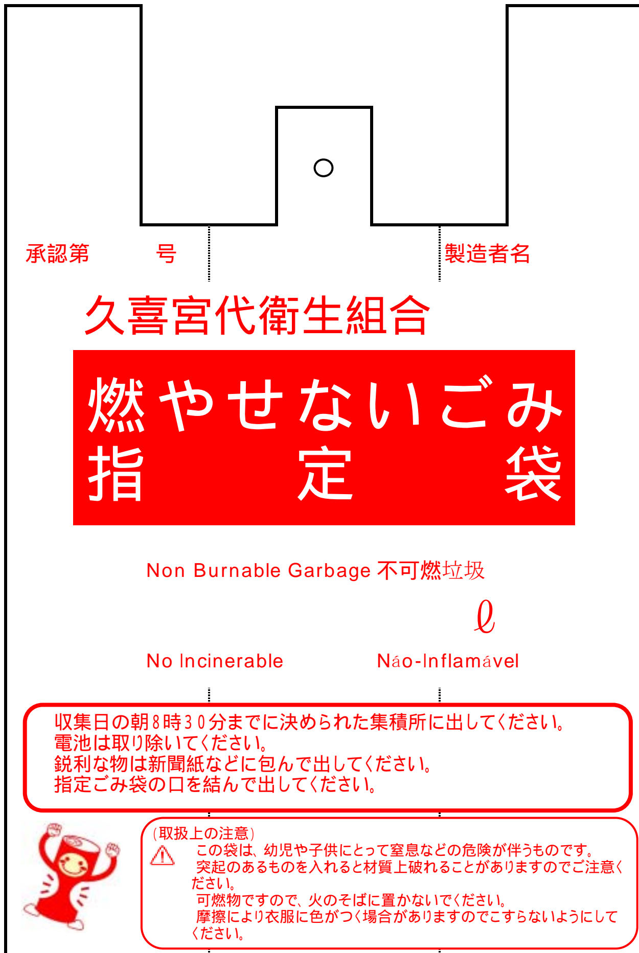
別図2 (第4条第2項) 燃やせないごみ用指定袋の表示