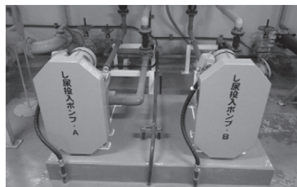
し尿投入ポンプ更新工事