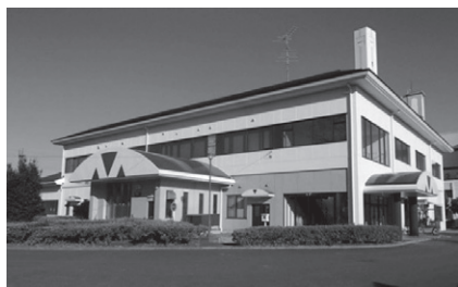
八甫清掃センターし尿処理施設