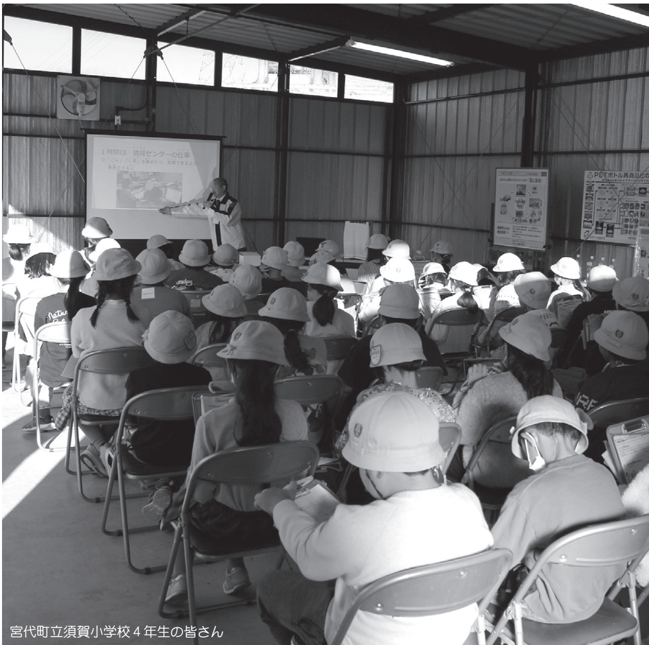
宮代町立須賀小学校 4年生の皆さん